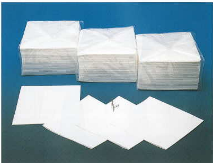
マイクロフレックスワイパー