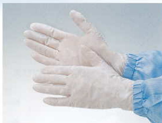
クラス100対応ニトリル手袋