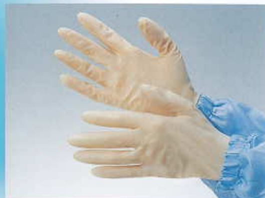
クラス100対応ラテックス手袋